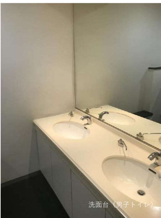
洗面台（男子トイレ）