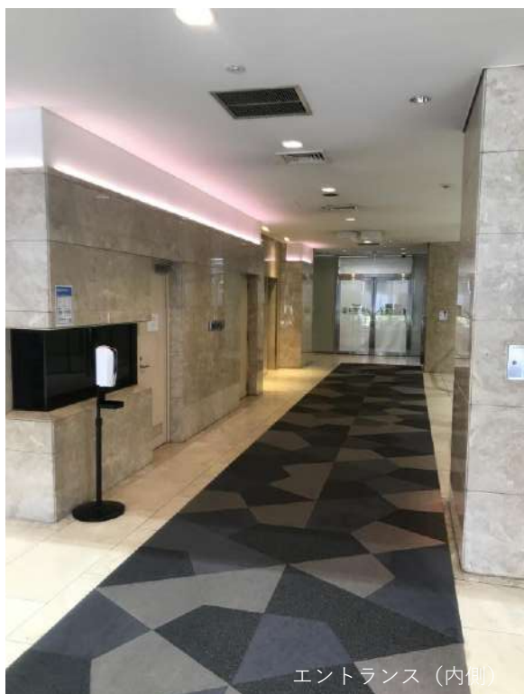
エントランス（内側）