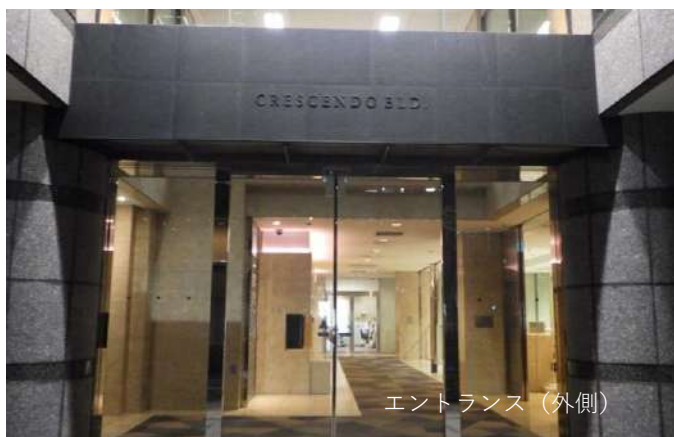
エントランス（外側）