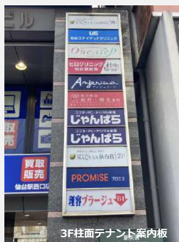
3F柱面テナント案内板