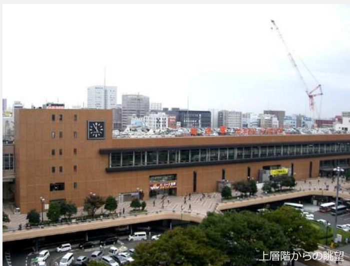
上層階からの眺望