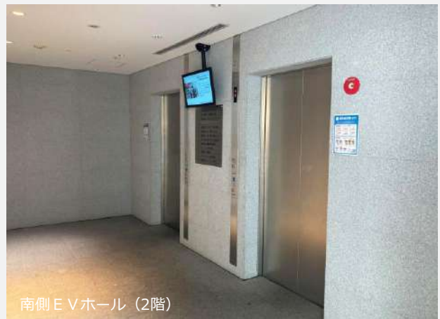
南側E Vホール (2階)