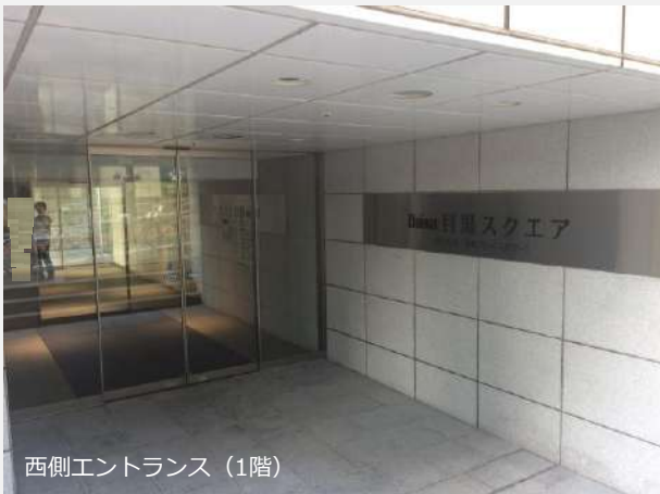
西側エントランス (1階)