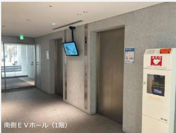
南側E Vホール (1階)