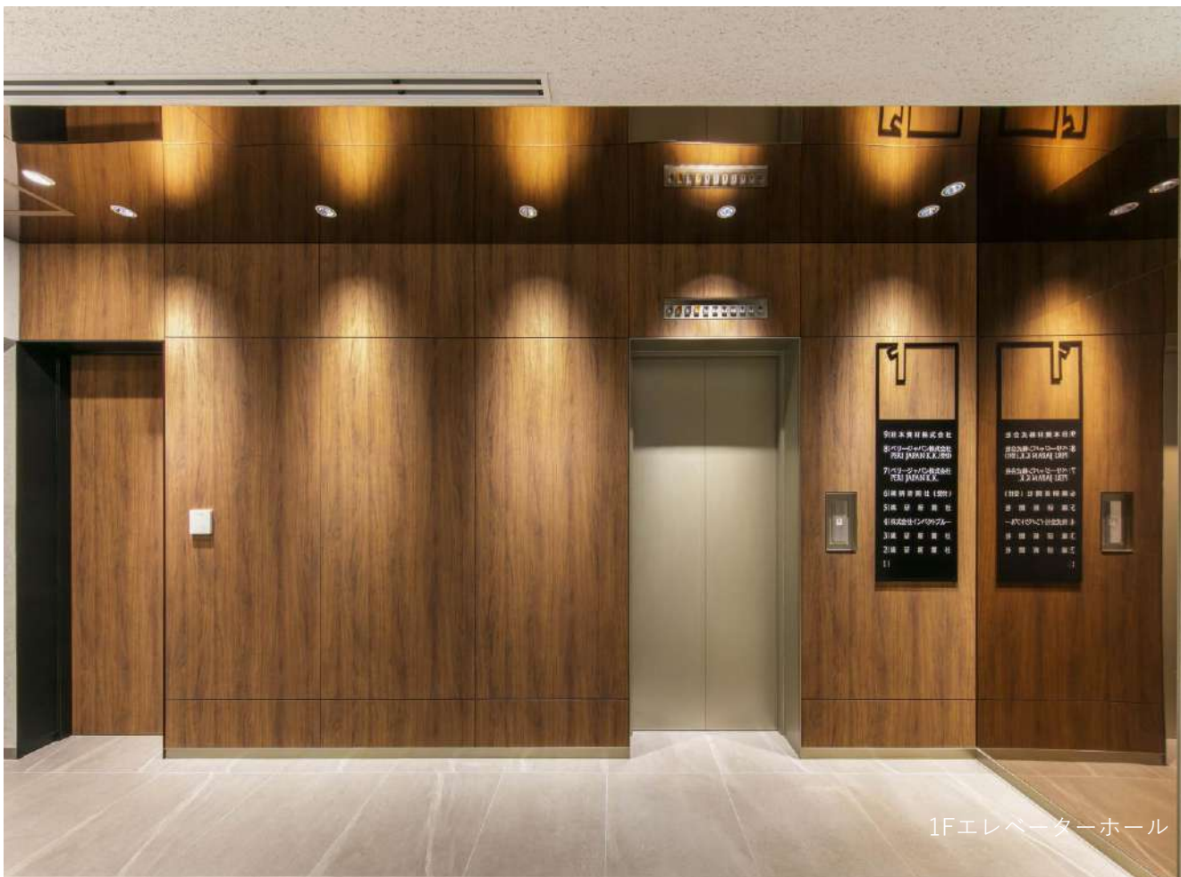
1Fエレベーターホール