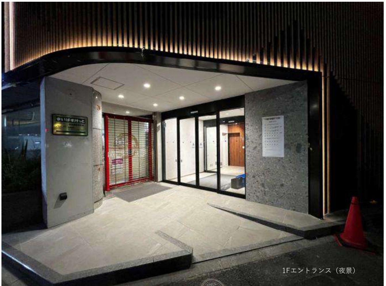
1Fエントランス (夜景)