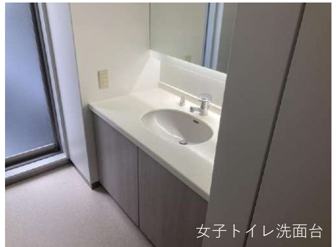
女子トイレ洗面台