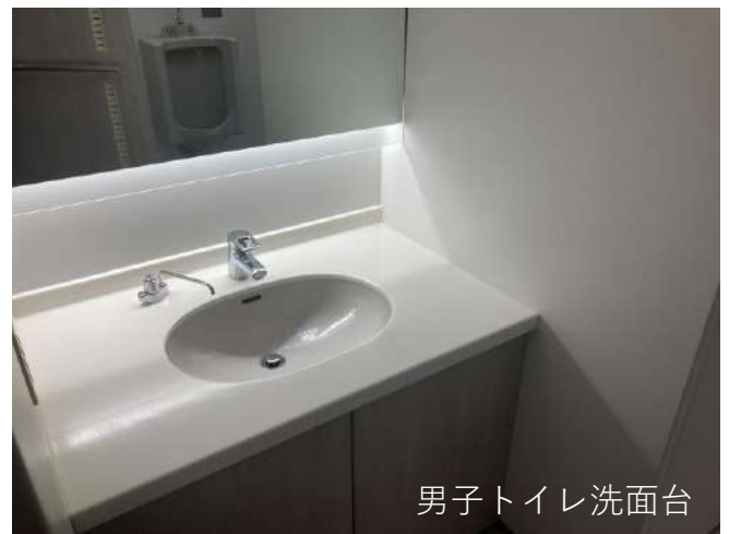
男子トイレ洗面台