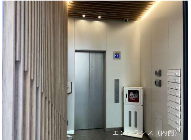
エントランス (内側)