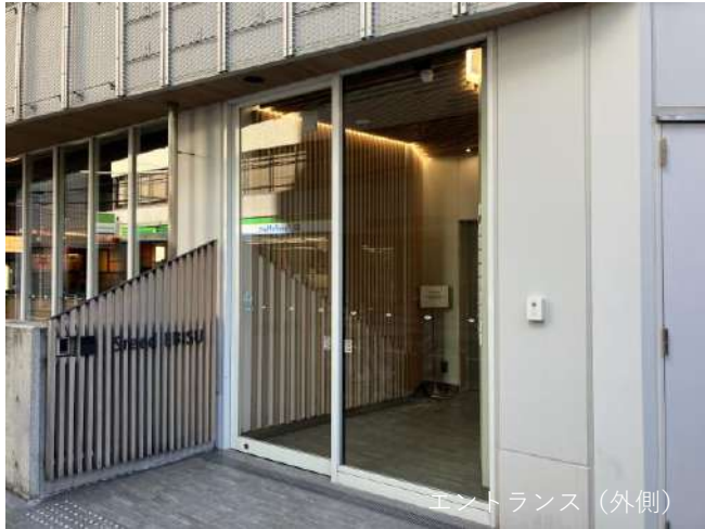
エントランス (外側)