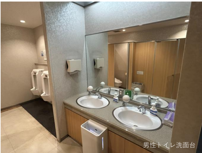
男性トイレ洗面台