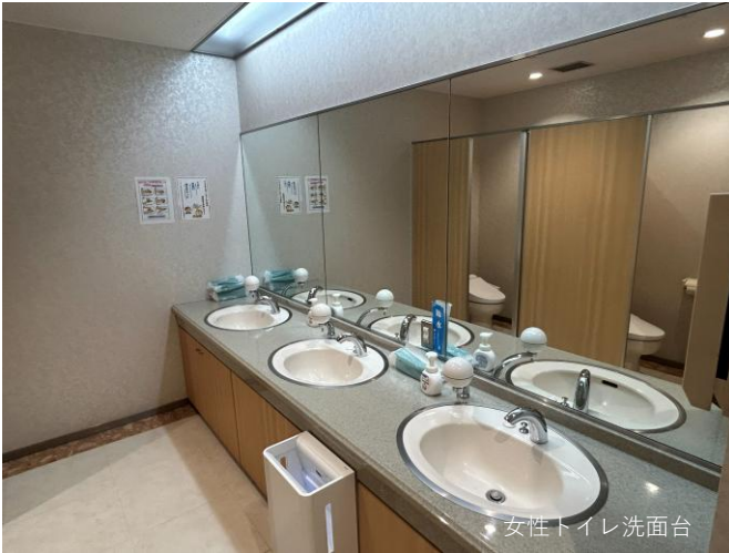
女性トイレ洗面台