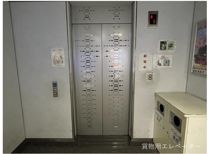
貨物用エレベーター